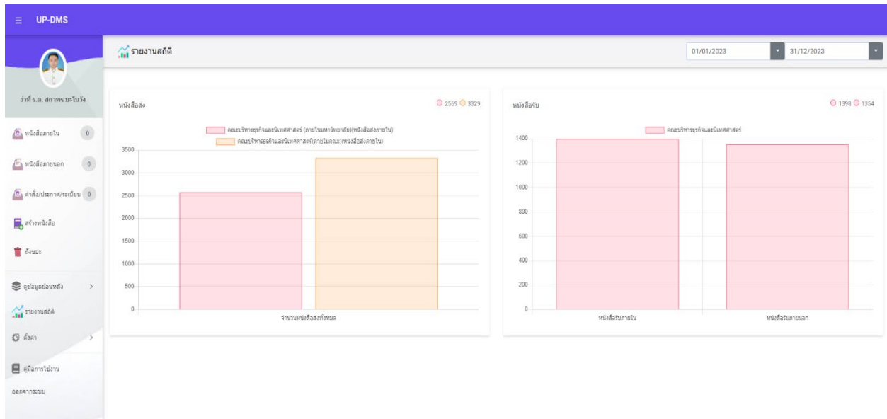
รูปที่ 2 ระบบ UP-DMS ที่เป็นระบบเอกสารอิเล็กทรอนิกส์ที่ช่วยลดปริมาณกระดาษได้มาก