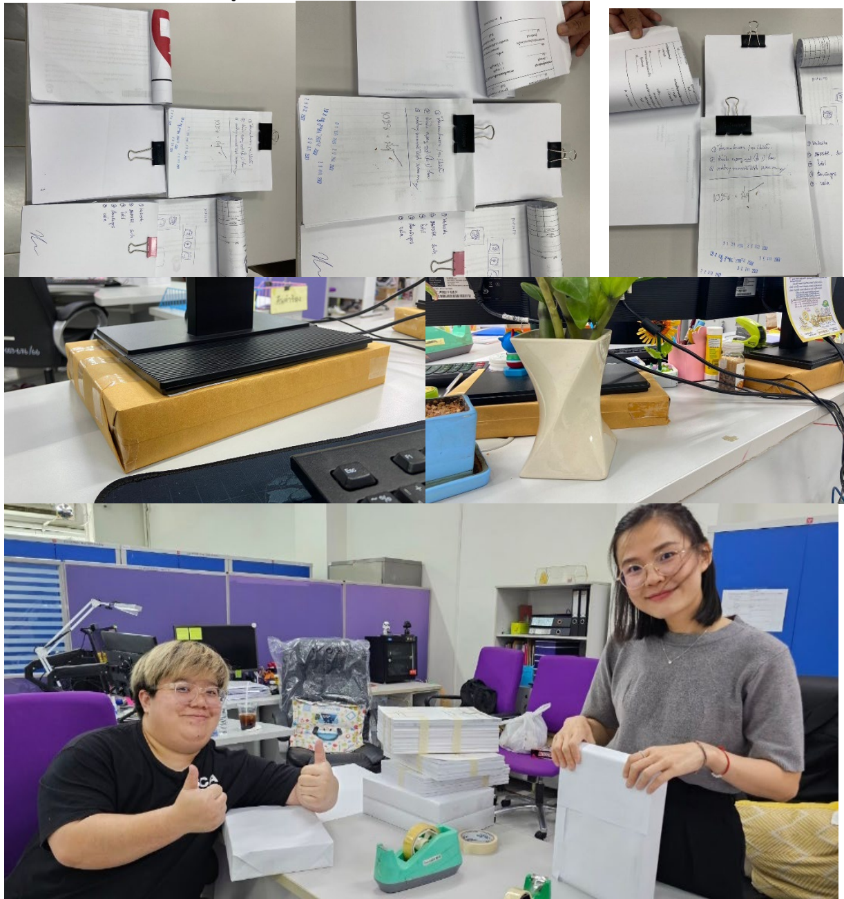
รูปที่ 4 การนำกลับมาใช้ใหม่ (Recycle)

สำนักงานมีการนำขยะกลับมาใช้ใหม่ (Recycle) เช่น การทำที่รองหน้าจคอมพิวเตอร์ด้วยการด้ายที่ใช้แล้ว 2 หรือ หรือเอกสารรายงานงานของนิสิต มาทำเป็นฐานรองหน้าจคอมพิวเตอร์เพื่อปรับสมดุลสายตา การเก็บรวบรวมห้วงเครื่องดืมและเศษแมคเพื่อนำไปบริจาคในการทำอวัยวะเทียม การเก็บรวบรวมปฏิทินเก่าเพื่อทำไปบริจาคทำอักษรเบลสำหรับผู้พิการทางสายตา