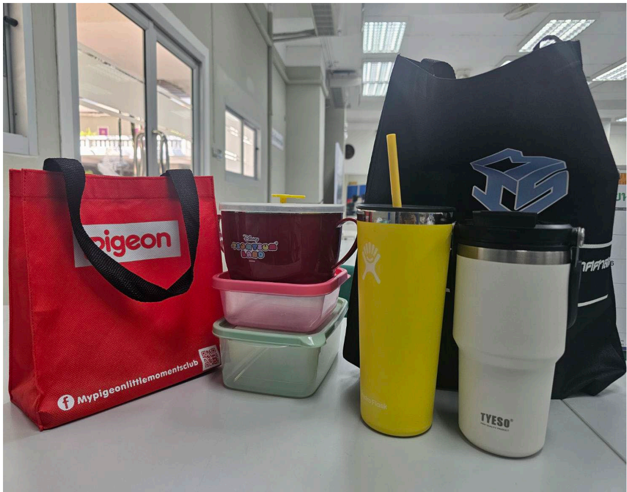
รูปที่ 1 การลดปริมาณขยะ (Reduce)

สำนักงานได้ดำเนินกิจกรรมลดปริมาณขยะ โดยการใช้ถุงผ้า ตะกร้า แทนถุงพลาสติก การนำภาชนะใส่อาหารแบบปิ่นโตกลับมาใช้ใหม่ ใช้แก้วเก็บความเย็นแทนแก้วน้ำพลาสติก นอกจากนี้ยังเปลี่ยนมาใช้ระบบเอกสารแบบ UP-DMS ทดแทนระบบที่ต้องปรี้นเอกสาร