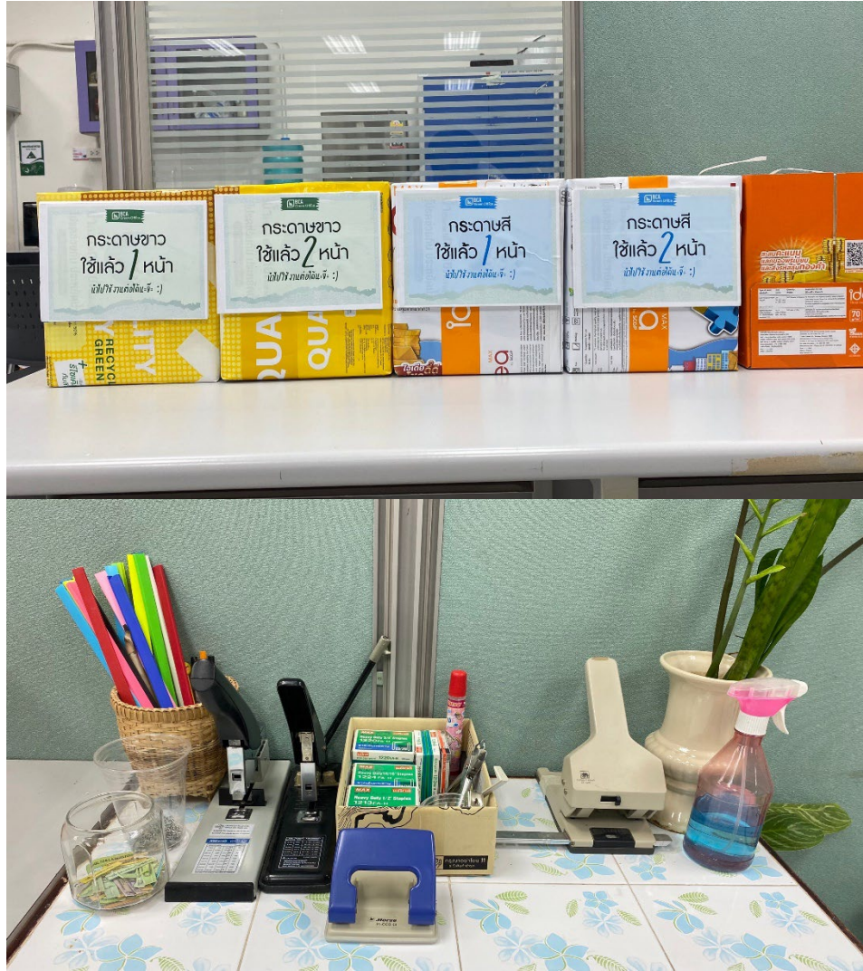
รูปที่ 3 การแยกกระดาษแต่ละประเภท และการนำเอากระดาษที่ใช้หน้าเดียวกลับมาใช้ซ้ำ

สำนักงานมีการนำกระดาษที่ปรี้นหน้าเดียวกลับมาใช้ซ้ำ โดยการแยกกระดาษที่ใช้แล้วแต่ละประเภทออกจากกันแล้วนำไปใช้หน้าเดียวกลับมาใช้ซ้ำอีก ซึ่งจะสามารถลดขยะที่เกิดขึ้นในสำนักงานได้เป็นอย่างดี